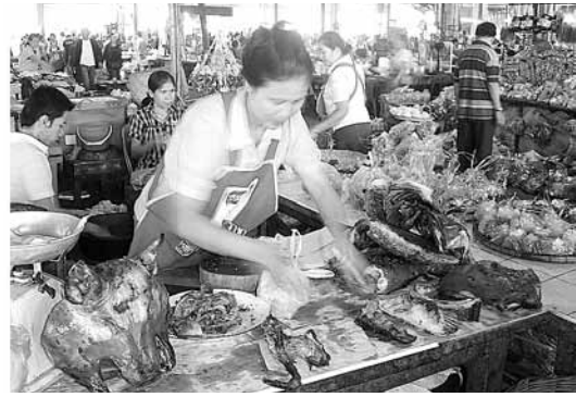
Figure 2 Roasted native swine in Lao PDR

ผลการทดลองเลี้ยงโดยใช้สูตรอาหารสุกรขุนในช่วงที่ 1 เป็นเวลาสองเดือน น้ำหนักสุกรเริ่มต้นเฉลี่ย 7.9 กก. สิ้นสุดเดือนที่สองได้น้ำหนักเฉลี่ย 13.0 กก. และต่อเนื่องไปอีกสี่เดือนในช่วงที่สอง เมื่อสิ้นสุดการทดลองได้น้ำหนักสุกรเฉลี่ย 26.1 กก. พบว่าสูตรที่มีโปรตีนร้อยละ 11, 9 และ 12, 10 ทำให้อัตราแลกเนื้อ (Feed conversion ratio, FCR) เฉลี่ยและต้นทุน (Cost) เฉลี่ยต่ำที่สุด ส่วนสูตรอาหารที่มีโปรตีนร้อยละ 12, 10 ทำให้อัตราการเจริญเติบโตเฉลี่ย (Average daily gain, ADG) ดีที่สุด และไม่พบความแตกต่างทางสถิติของความหนาไขมันหลัง (Back fat, BF) และร้อยละของซาก (Dressing percentage) ปรากฏดัง Table 1