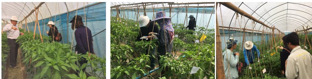
Figure 3 Technological transfer of "Redsun Esarn" variety to Spa Agriculture Co., Ltd.