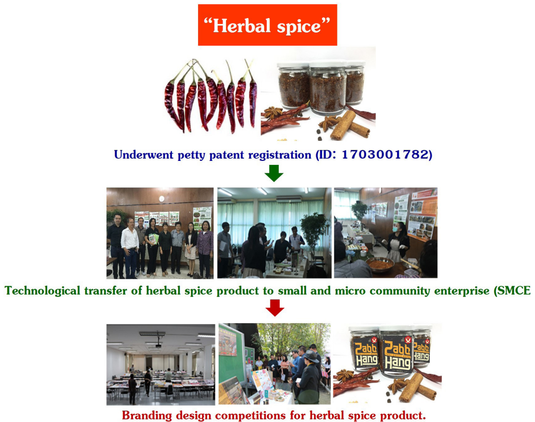
Figure 4. “Herbal spice”: product improvement method for food utilization