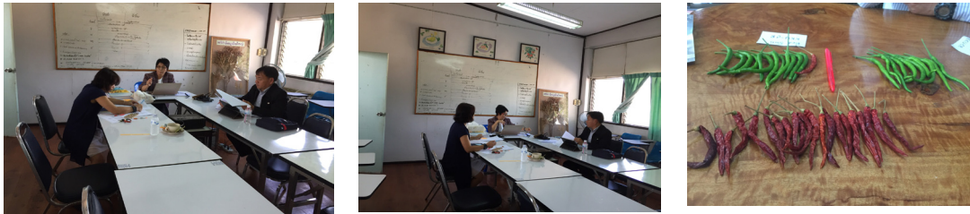
Figure 2 Memorandum of understanding between Khon Kaen University and Spa Agriculture Co., Ltd.